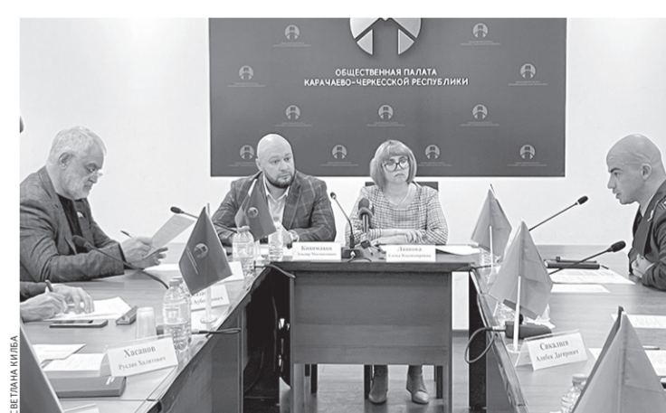
На круглом столе шло живое обсуждение темы с участием представителя прокуратуры

Как говорили на совещании, в каждом бизнесе есть свой уровень риска. Это тот вред безопасности государства, здоровью людей, окружающей среде и бюджету, который может причинить предприниматель, если он нарушает обязательные требования. В Законе № 248-ФЗ периодичность плановых проверок компаний напрямую зависит от категории риска. Чем она выше, тем чаще на предприятие придет инспектор. Класс опасности объек-