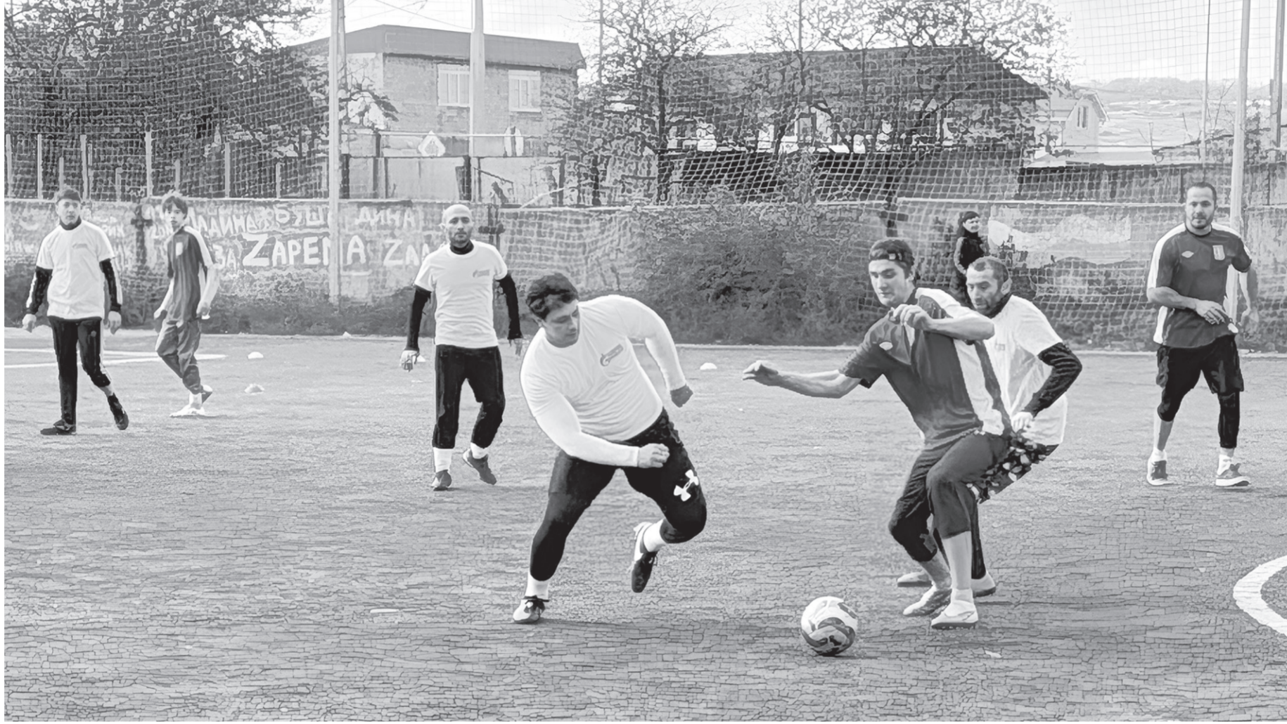
На футбольном поле развернулась нешуточная борьба за мяч

— В этом году мы пригласили 18 организаций, из них 10 участвовали, остальным пришлось отказаться, потому что не смогли набрать необходимое количество людей в команду для участия. Главная задача турнира — это дать возможность людям, веду-