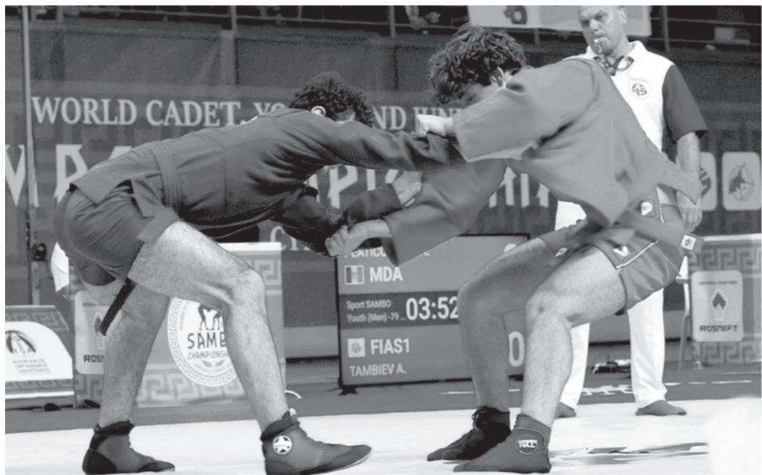
Страсти на татами кипят нешуточные, каждый борец бьется до конца

В рамках реализации федерального проекта «Единой России» «За самбо» этот вид спорта стремительно развивается в Карачаево-Черкесии. Спортивные секции самбо открываются во всех городах и районах республики. В настоящее время на территории КЧР занятия самбо проходят в 6 спортзалах. Так, в 2023 году в Черкесске такой зал открылся на территории гимназии № 18. Этот небольшой зал, оснащённый всем необходимым для занятий самбо, рассчитан на 20 человек, поэтому тренировки здесь проходят посменно. Также в Черкесске планируется построить республиканский центр самбо, где смогут заниматься и повышать своё спортивное мастерство талантливые ребята со всей республики. Кроме того, в рамках проекта проводятся курсы повышения квалификации тренеров по разным видам еди-