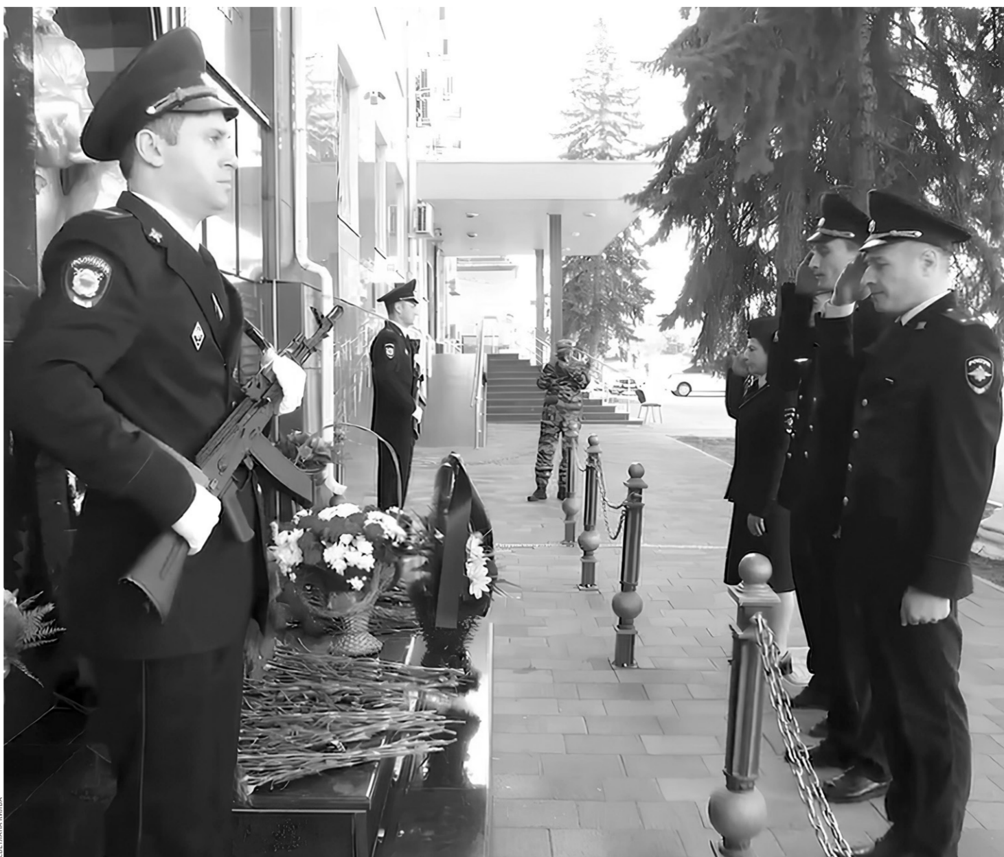
К мемориалу погибшим сотрудникам полиции легли живые цветы