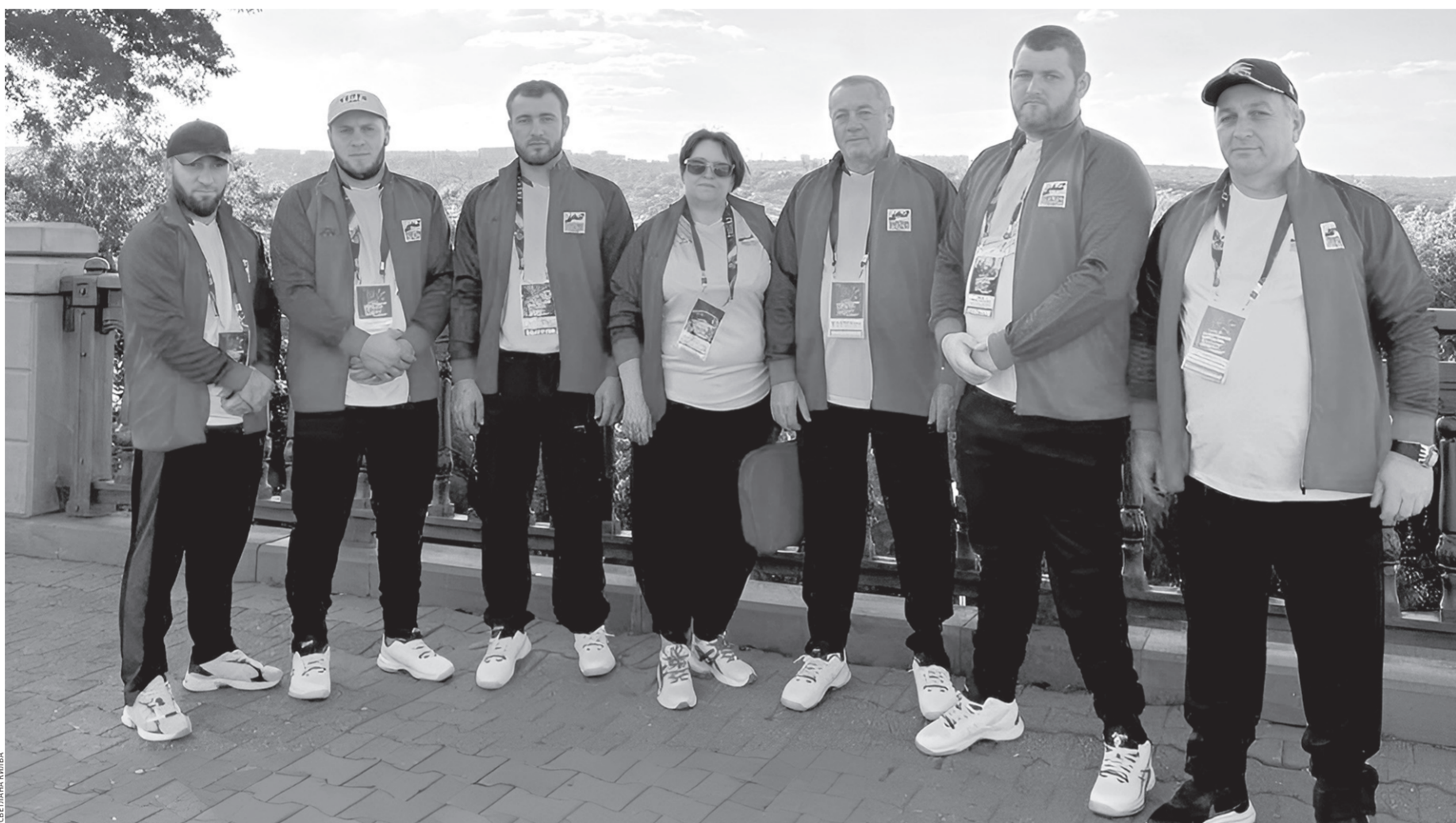
Эти ребята — настоящие герои нашего времени

На торжестве рассказали, что организаторами спортивных мероприятий является фонд «Защитники Отечества», Паралимпийский комитет России, Министерство спорта Российской Федерации, правительство Ставропольского края и Всероссийская федерация спорта лиц с поражением опорно-двигательного аппарата. Прошедшие в Ставрополе нынешние состязания среди ветеранов СВО — это пятое